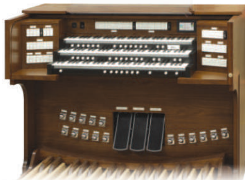
Stop Tab console pictured with optional GENISYS Voices and 32-Note Parallel Pedalboard.

Innowacyjne wytwarzanie zapewnia nieporównywalne opcje personalizacji i wsparcia produktu. Allen produkuje układy elektroniczne, kontuary, registry oraz zespoły we własnym zakresie. To, wraz z poświęceniem na rzecz jakości oraz zapewnieniem części zamiennych dla starszych modeli, przekłada się na instrumenty, które wystarczają na dłużej i są tańsze w utrzymaniu na dłuższą metę.