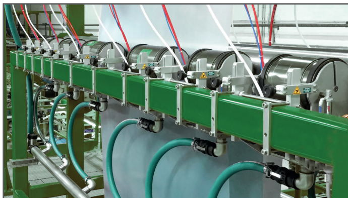
Montaż na wsporniku w celu drukowania za pomocą kilku maszyn na tej samej linii Installation on supporting bracket to print with several machines on the same line