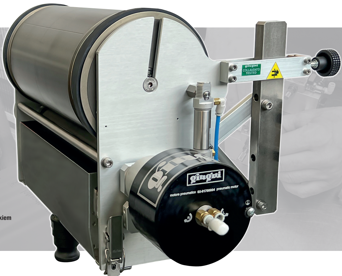
Miniflex® 390 z silnikiem pneumatycznym Miniflex® 390 with pneumatic motor