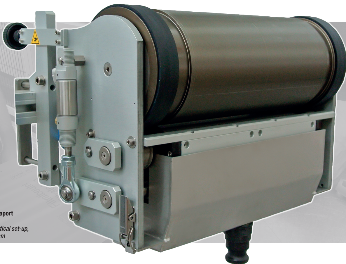
Miniflex® 385-300 raport pionowy 500 mm Miniflex® 385-300 vertical set-up, printing repeat 500 mm