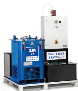
Wirówki do oczyszczania ścieków obróbkowych