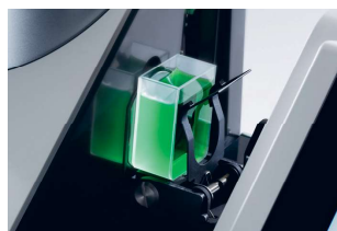
Pomiar przezroczystych i mętnych cieczy

Do cieczy można stosować szklane i plastikowe kuwety o długości drogi optycznej do 60 mm, przy zastosowaniu opcjonalnego adaptera także standardowe kuwety o szerokości 12,5 mm.