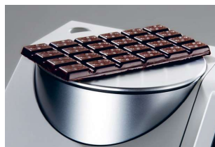
Pomiar nieprzezroczystych ciał stałych

Trzy wymienne przysłony o średnicy 30, 8 i 3 mm umożliwiają wygodny pomiar próbek stałych o różnej wielkości i kształcie.