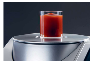
Pomiar nieprzezroczystych past i proszków

➔ Wystarczy rozsunąć obudowę urządzenia, aby otworzyć dużą komorę do pomiaru w transmisji, niezbędną do pomiaru próbek przezroczystych, takich jak folie i tafle.