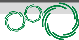
STACK TYPE 958