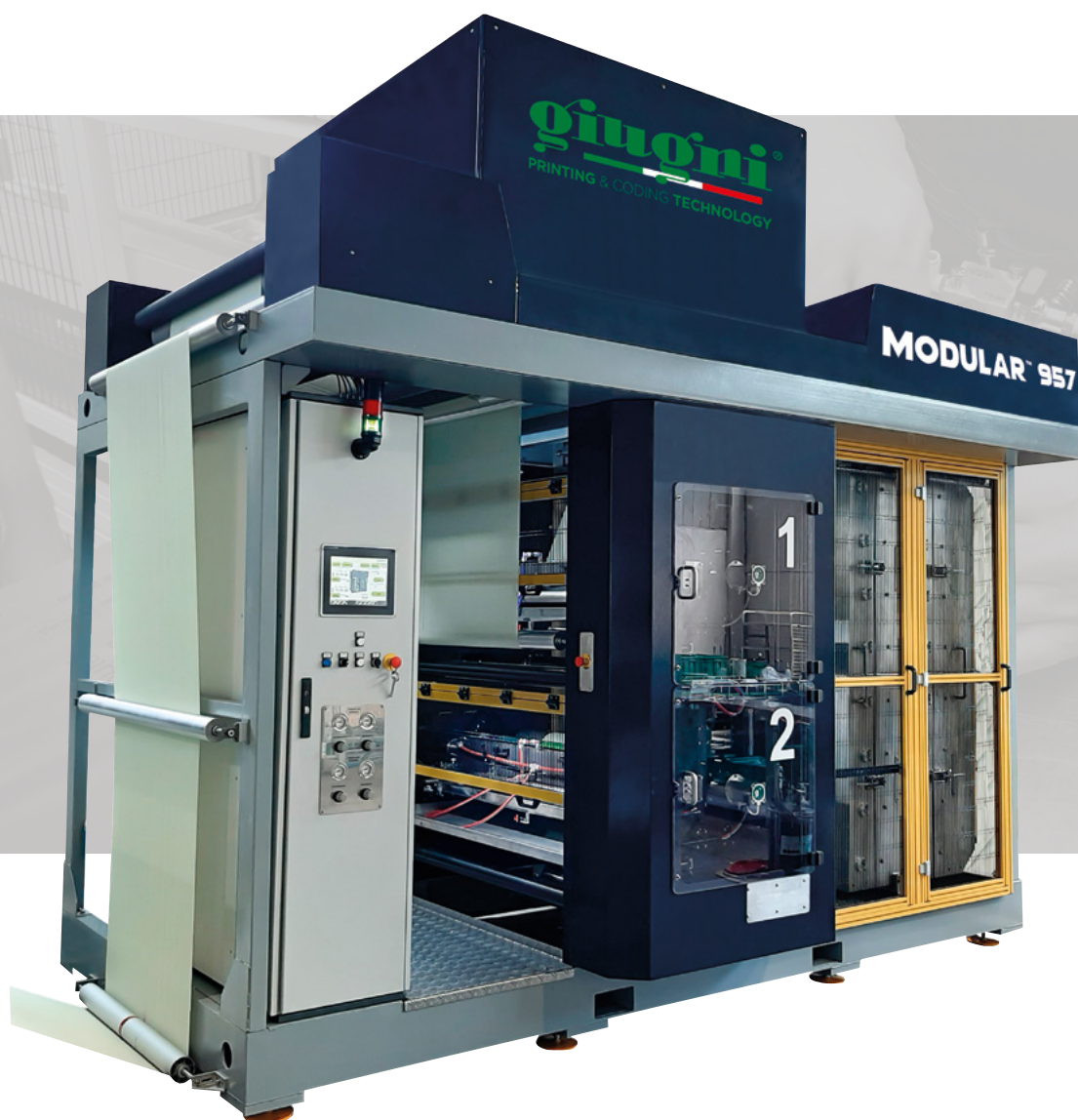
STACK TYPE 957