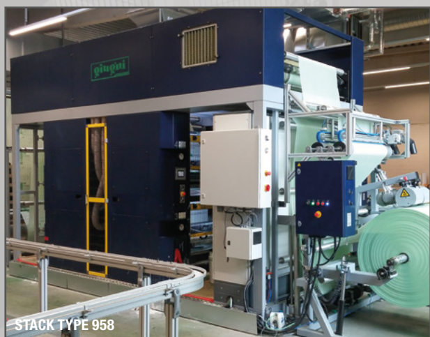
STACK TYPE 958