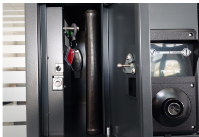
Moduł skrytkowy na klucze i dokumenty do pojazdów