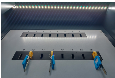
Moduł keybox - ze slotami na klucze, monitoringiem statusu i jego identyfikacji

Skalowalność rozwiązania sprawia, że jest w stanie spełnić potrzeby zarówno małych, jak i dużych organizacji. Użytkownicy autoryzowani są w systemie na podstawie kart pracowniczych, a klucze czy sprzęty oznaczane są za pomocą breloków z układem zbliżeniowym.