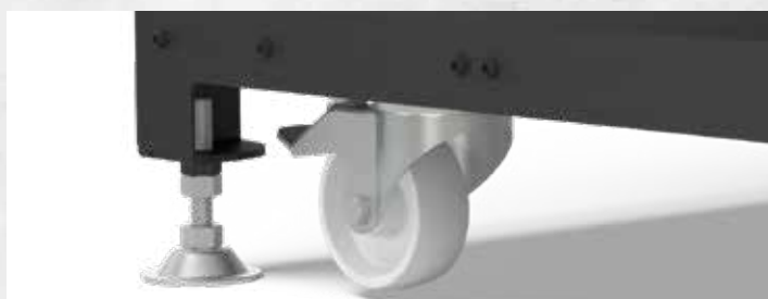
Opcjonalnie: 4 koła z hamulcem blokującym