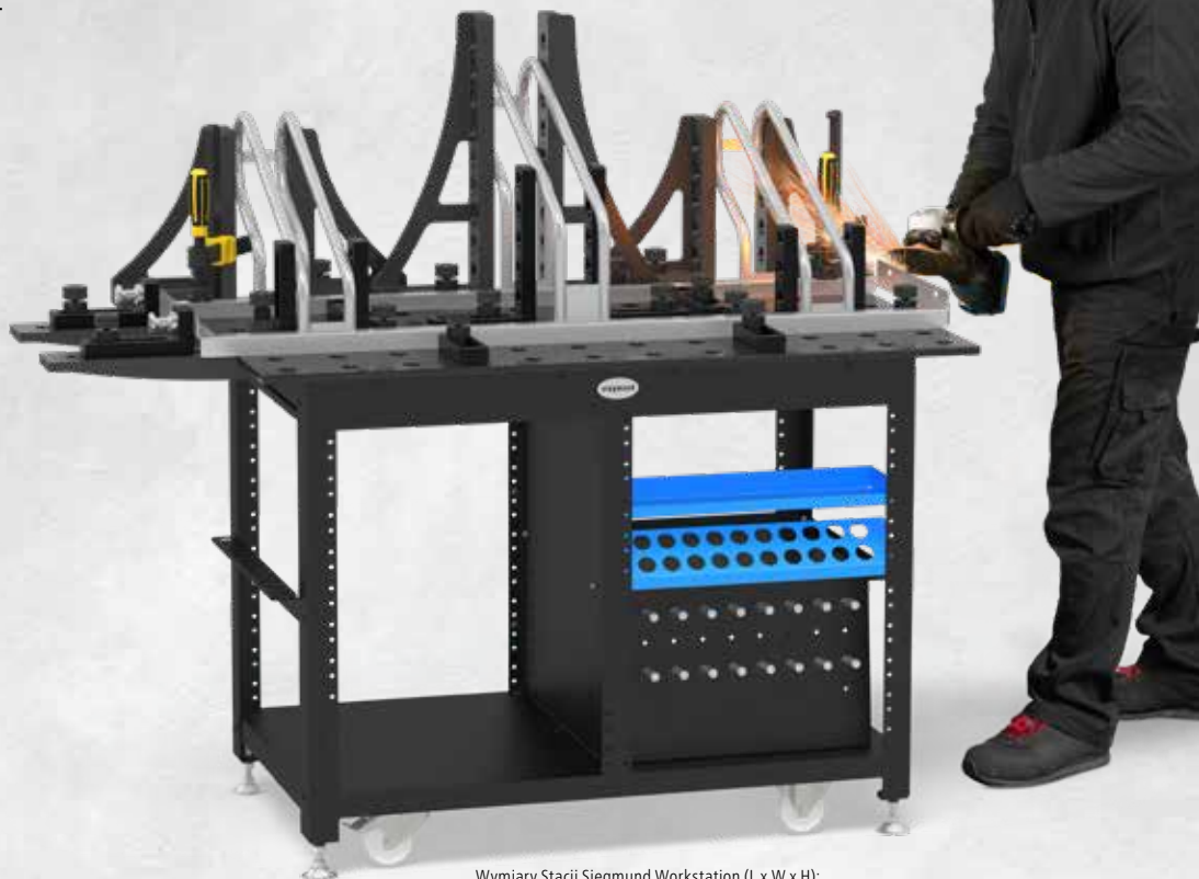
Wymiary Stacji Siegmund Workstation (L x W x H): 1200 x 800 x 850 mm

Podczas pracy z drewnem lub metalami stację roboczą wykorzystujemy w 100%, aby realizować wszystkie pomysły i projekty. Narzędzia są zawsze pod ręką w wytrzymałych stalowych szufladach.