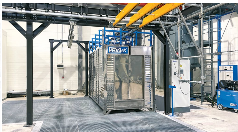
⬆ Linia do malowania proszkowego według koncepcji RUBICOAT®.

lokalowych klientów. Dzięki tej konfigurowalności i modułowości linia otrzymała nazwę RUBICOAT®, gdyż proces wzajemnego zestawiania urządzeń przypomina układanie kostki Rubika, stanowiące jedno ze źródeł inspiracji dla inżynierów SciTeeX.