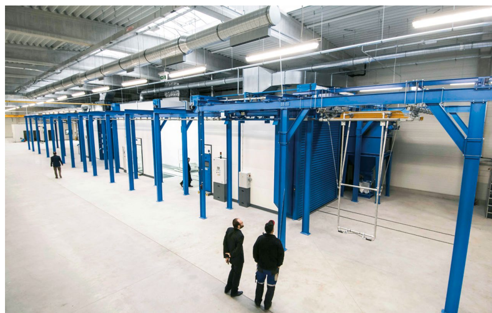
↑ Linia do malowania ciekłego zakończona suszarką Infrared (IR).

Dzięki silnemu zespołowi profesjonalistów, SciTeeX wspiera swoich klientów w zakresie doradztwa i doboru maszyn. ✕