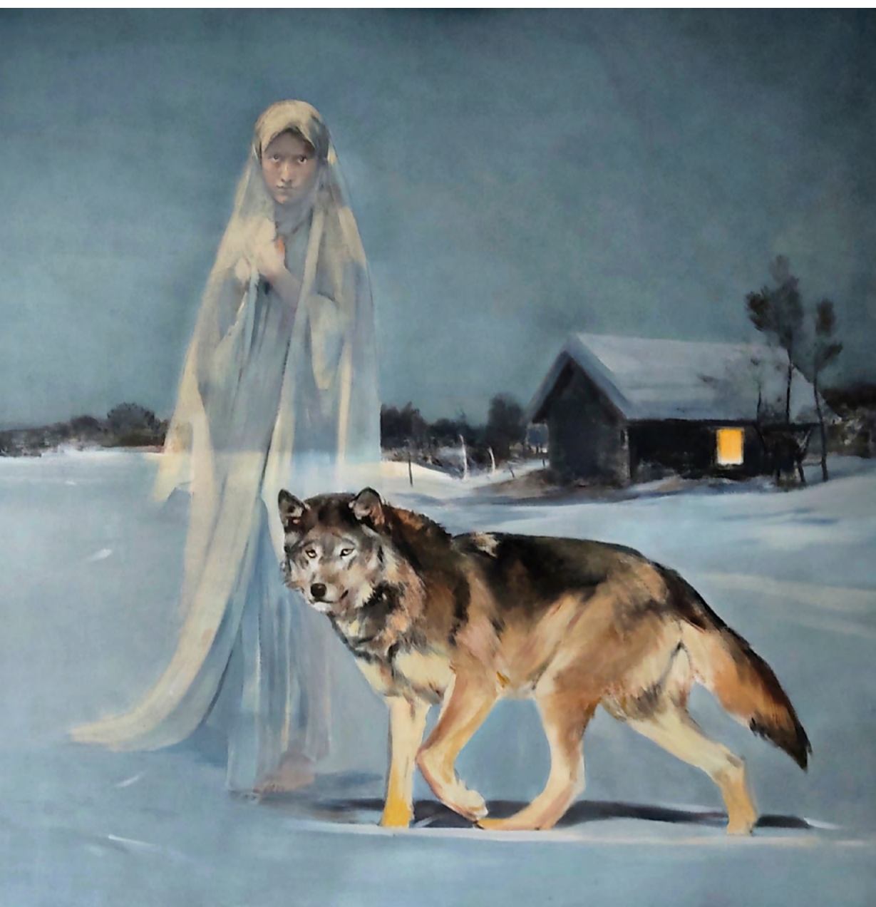
Obraz "Gromniczna i wilk lutowy", Jan Dubrowin, 2023

Kilkaset obrazów i rzeźb autorstwa ponad stu artystów zaprezentowanych zostanie podczas Wystawy Sacroexpo w dniach od 19 do 21 czerwca w Targach Kielce! Co więcej – wybrane dzieła będzie można wylicytować podczas aukcji.