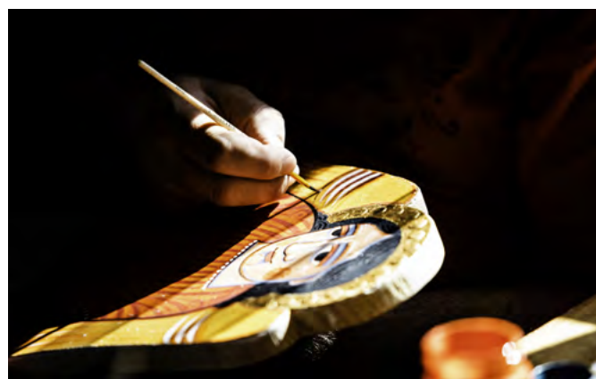
Nowica 2019 – plener ikonopisarzy