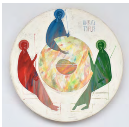
Ikona "Trójca Święta", Khrystyna Kvyk, 2022

Strefa Sztuki to nowość targów branży sakralnej. Zostaną w niej zaprezentowane dzieła stworzone wedle współczesnych trendów religijnych. Odwiedzając kielecką wystawę od 19 do 21 czerwca będzie można obejrzeć kilkadziesiąt oryginalnych obrazów oraz rzeźb wykonanych przez ponad stu artystów. Drugiego dnia Sacroexpo, 20 czerwca część z prezentowanych dzieł będzie można wylicytować w trakcie aukcji sztuki prowadzonej na żywo.