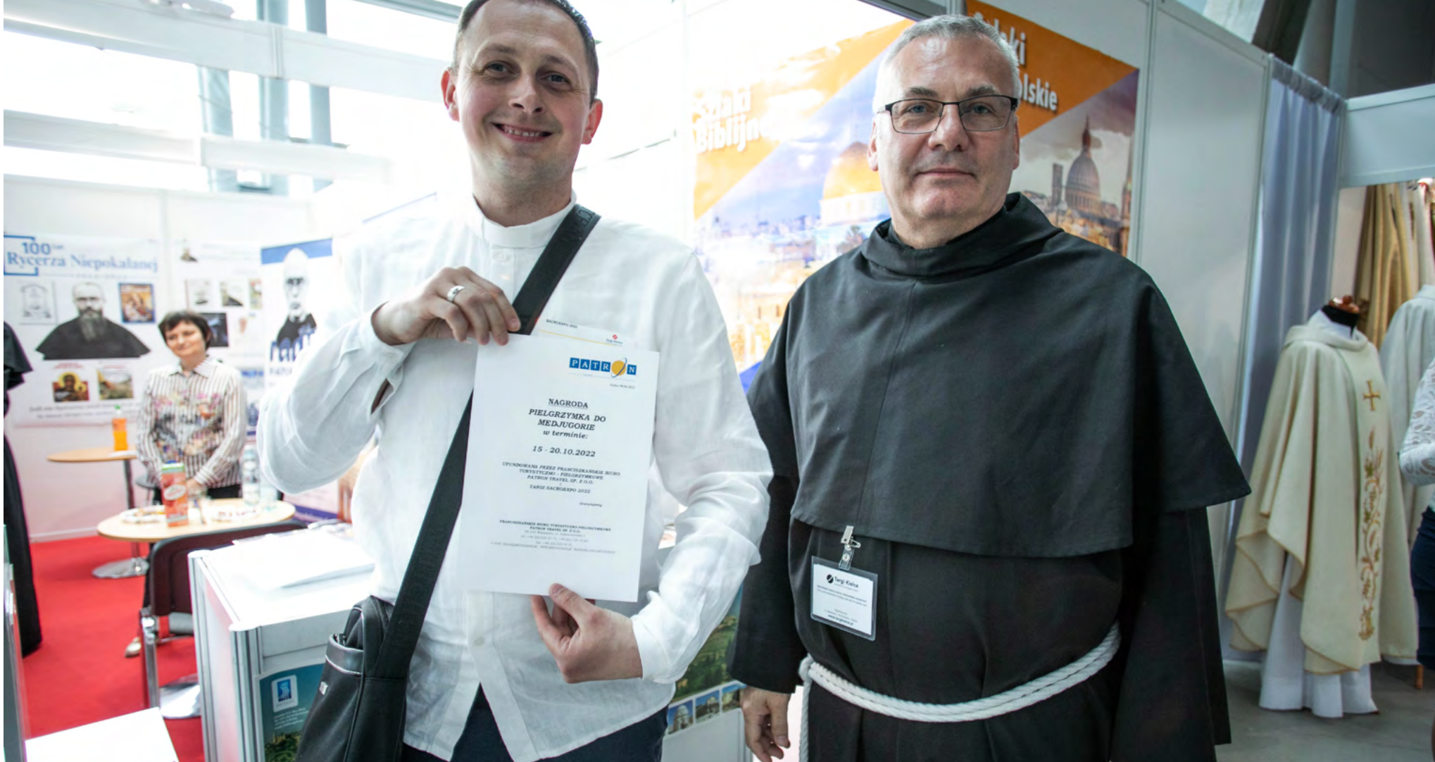
Nagrodą w ubiegłorocznym konkursie był sześciodniowy wyjazd do Medjugorie.