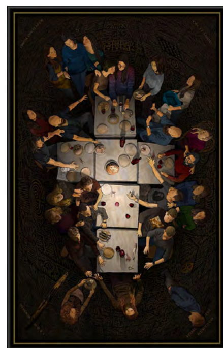
Neowitraz "Ostatnia Wieczera XXI", Piotr Barszczowski, 2021

Ważną część Strefy Sztuki stanowią będą nowoczesne, abstrakcyjne, często minimalistyczne ikony stworzone przez artystów związanych z lwowską galerią Icon Art, a także te powstałe na plenerach w Nowicy.