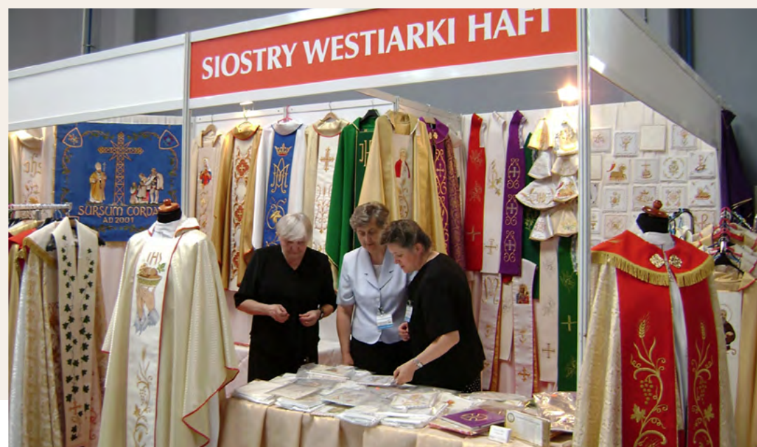
Prace Zgromadzenia Sióstr Westiarek w Targach Kielce prezentowane podczas Wystawy Sacroexpo cieszą się dużym uznaniem.

Unikatowe szaty liturgiczne wykonane przez Westiarki Jezusa cieszą się ogromnym zainteresowaniem podczas wystawy Sacroexpo w Targach Kielce. Najnowsze modele ornatów, stuły kapłańskie uszyte ręcznie, a także z pomocą komputera będzie można obejrzeć i zakupić w dniach od 19 do 21 czerwca.