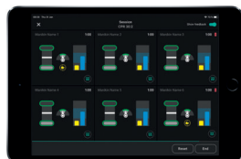
Precyzyjne informacje zwrotne