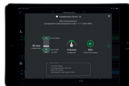
Dane z sesji