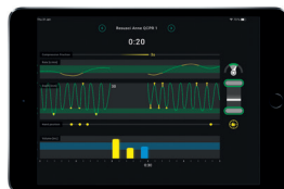
Widok osi czasu