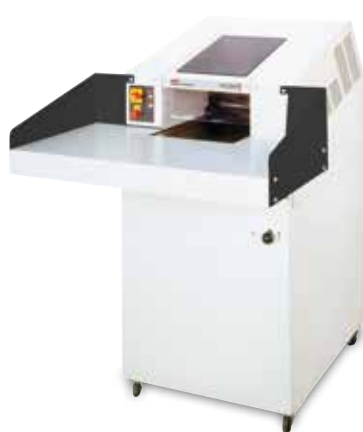
HSM Powerline FA 400.2