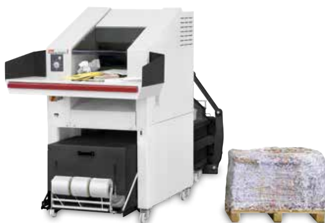
HSM Powerline SP 5088