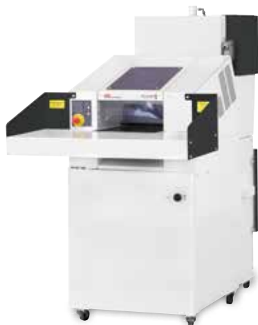
HSM Powerline SP 4040 V

Urządzenie dostępne opcjonalnie dla: HSM Powerline FA 400.2, FA 500.3, SP 4040 V, SP 5080, SP 5088