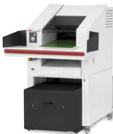
HSM Powerline SP 5080