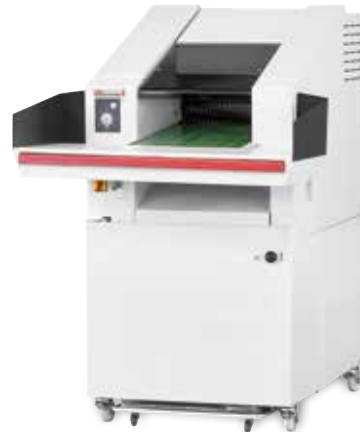
HSM Powerline FA 500.3