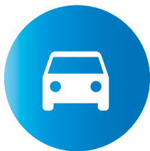
branża samochodowa automotive