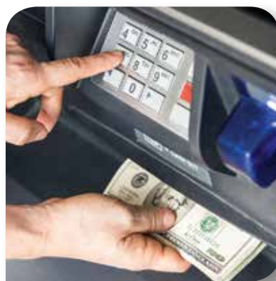
BIZNES I BANKOMATY