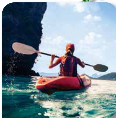
SPORT I REKREACJA