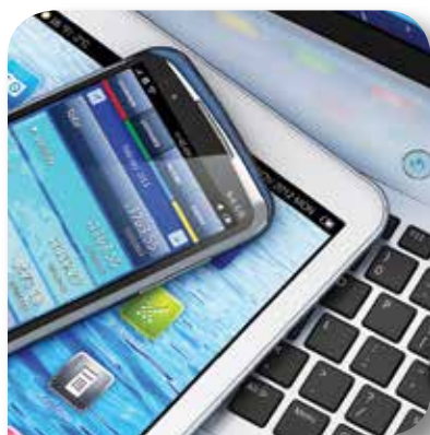
PRZEMYSŁ ELEKTRYCZNY I ELEKTRONICZNY