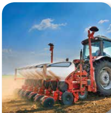
ROLNICTWO I TRANSPORT INNY NIŻ SAMOCHODOWY