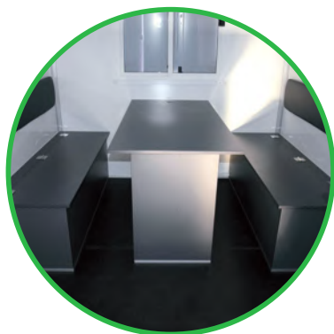
Stół i 2 ławki z podnoszonymi siedziskami i oparciami