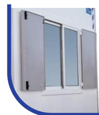
Okno z przeszkleniem spełniającym normę R43