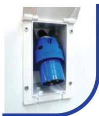
Przyłącze energii elektrycznej (opcjonalnie)