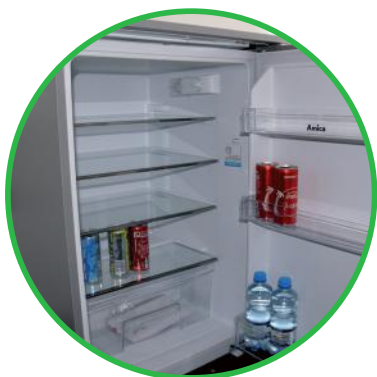
Lodówka w zabudowie meblowej