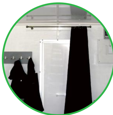
Garderoba z 4 podwójnymi haczykami, karnisz z ognioodporną kurtyną