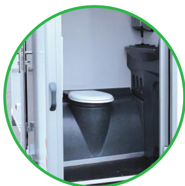
Toaleta ze zintegrowanym zbiornikiem