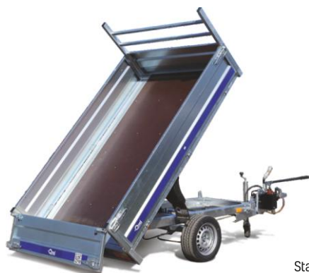
Stalowe lub aluminiowe burty h=40 cm