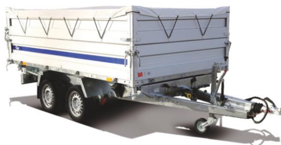
📌 Nadstawki burtowe z plandeką płaską