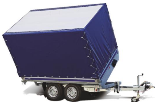
📌 Plandeka ze stelażem