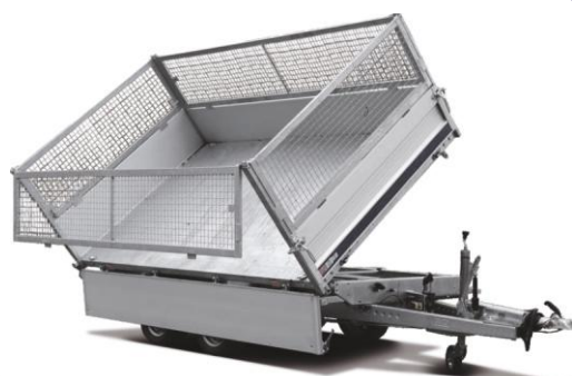
📌 Nadstawki siatkowe