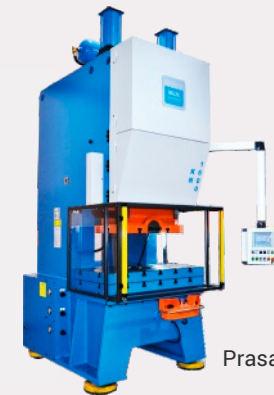
Prasa mimośrodowa MA.TE