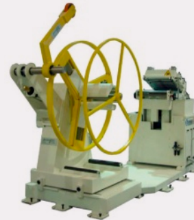
Linia podająca ASSERVIMENTI PRESSE