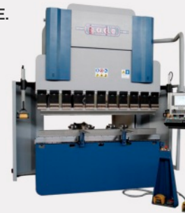
Prasa krawędziowa G.A.D.E.