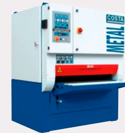
Szlifierka szerokotaśmowa COSTA LEVIGATRICI